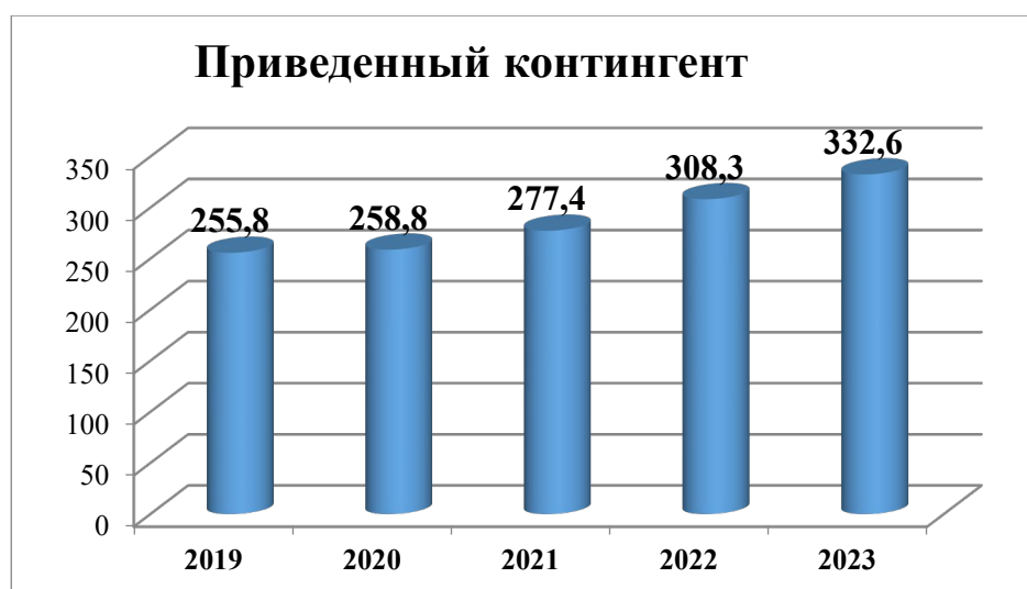
Рисунок 2.1 – Приведенный контингент

На рисунке 2.1 показана динамика приведенного контингента Филиала за 2019-2023 гг.