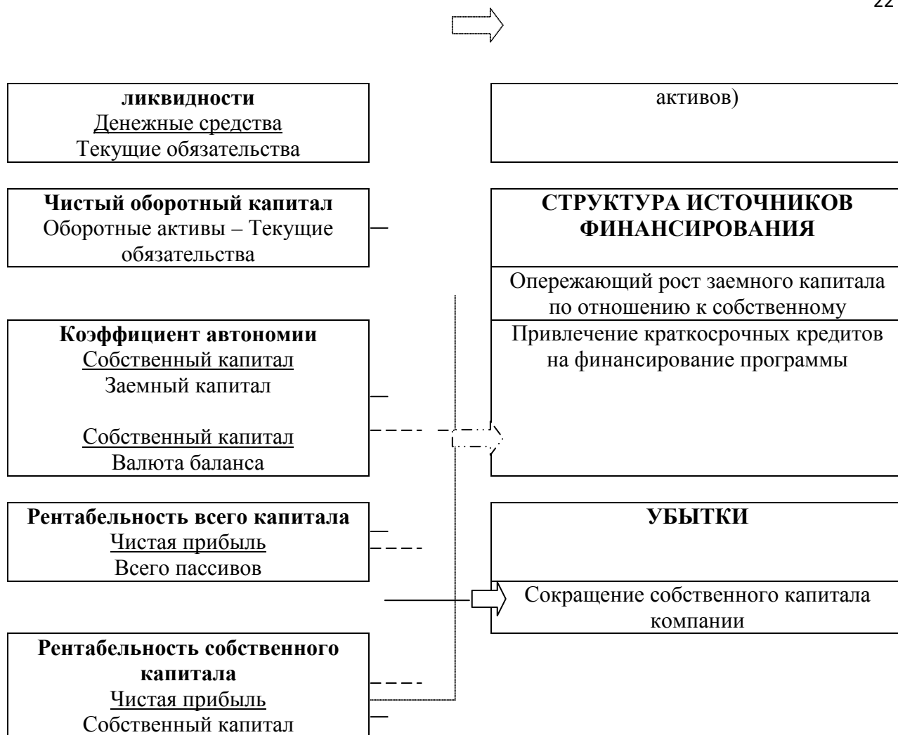
Рис.2. Причины снижения основных финансовых показателей деятельности компании

Следует также помнить, что финансовая устойчивость взаимосвязана с рентабельностью обратной зависимостью: при прочих равных условиях повышение финансовой устойчивости приводит к снижению рентабельности, и наоборот. Иллюстрация такой зависимости, сформированная на основе структуры коэффициентов финансового анализа, представлена на рис. 3.