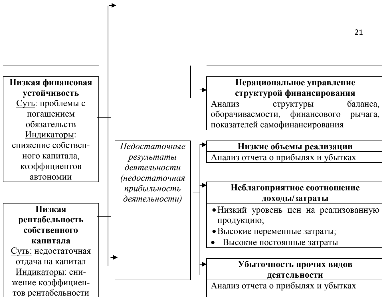
Рис.1. Проблемы и причины ухудшения финансового положения

Представленные на рис. 1 причины являются примерными, а их перечень не представляет собой исчерпывающий. У позитивных и негативных изменений в деятельности предприятия могут быть также и другие причины (если доступ к информации о деятельности предприятия ограничен, следует сделать предположения о причинах изменений, которые будут носить в этом случае достаточно общих характер).